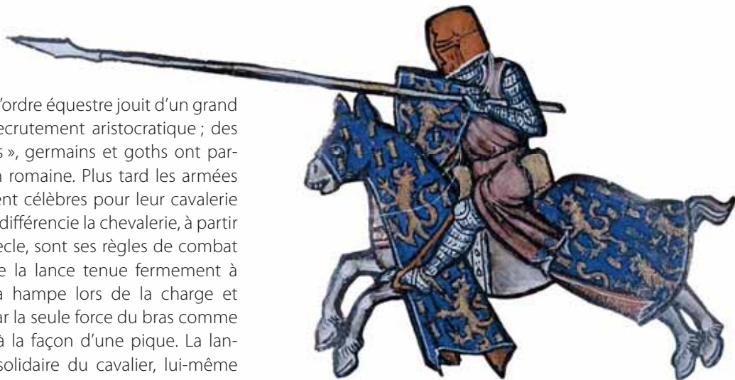
► Chevalier chargeant, épistolier de Cambrai, XIII e siècle

Dès le XI e siècle la chevalerie possède des valeurs qui se diffusent dans toute la société médiévale : prouesse, par la démonstration de sa force physique lors des exploits militaires, loyauté entre pairs pendant le combat, sens de l'honneur en défendant sa réputation ou celle de son seigneur et enfin largesse, par le mépris de la richesse. Ce code de conduites, établi peu à peu grâce aux tournois, va introduire une conception moins barbare de la guerre avec moins de massacres systématiques et de déportations des populations civiles. Mais c'est surtout la christianisation des valeurs chevaleresques, par l'adoubement d'abord, puis par la croisade, qui fait du chevalier un guerrier preux qui doit faire preuve de mansuétude, un miles Christi , un combattant du Christ (chevaliers du Temple, de l'Hôpital, Teutoniques). L'institution religieuse, dont une partie du haut clergé se recrute parmi la chevalerie, encourage dès lors la prouesse au service des pauvres, les largesses au bénéfice de l'Église. À partir de la fin du XII e siècle une autre influence marque l'esprit chevaleresque, la courtoisie. Ce nouvel art de vivre se manifeste par le respect absolu porté à une dame mais aussi le service d'une cause juste. Le chevalier devient alors le défenseur des plus faibles, celui qui combat le mal sans relâche.