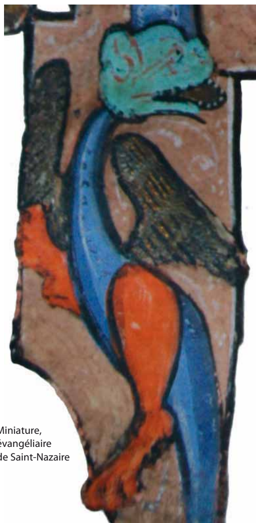
► Miniature, évangélaire de Saint-Nazaire

Avec l'importance des cultes des saints sont composés des textes lus durant l'office ou au réfectoire : ce sont les légendiers, textes hagiographiques qui racontent la vie des saints ( La légende dorée par le dominicain Jacques de Voragine au XIII e siècle).