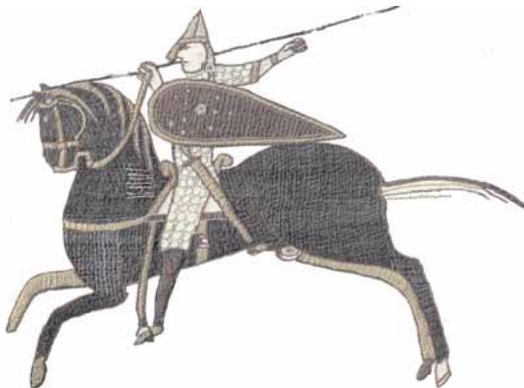
► Chevalier chargeant, tapisserie de Bayeux, XI e siècle, détail