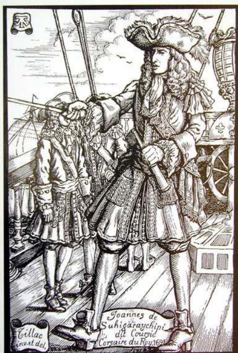
Doc 5 : Corsic, corsaire bayonnais