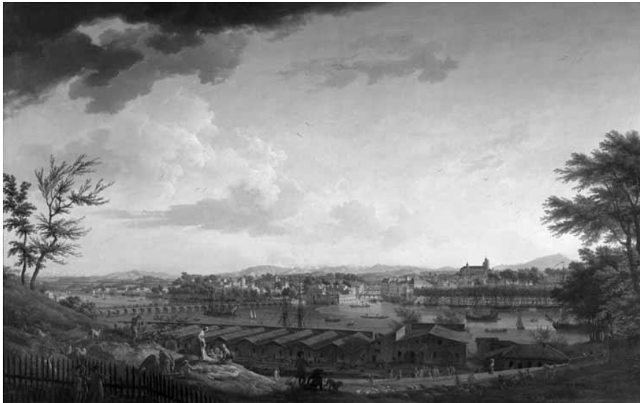
Doc 1 : Vue de Bayonne en 1760 par Vernet – Musée de la Marine