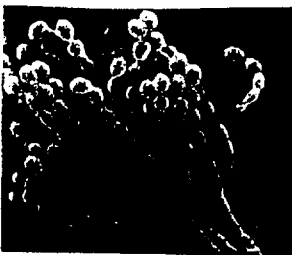
ex : penicillium roquefati

VIRUS ; PROTOZOAIRE ; BACTÉRIE ; CHAMPIGNON MICROSCOPIQUE.