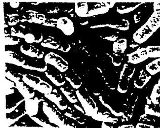
ex : bacille lactique