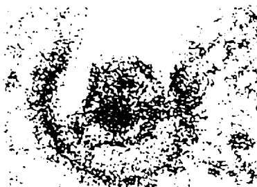
ex : agent de la grippe