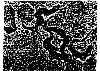
ex : hematozoaire du paludisme

1.2 Les voies de pénétration des microorganismes.