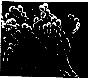
ex : penicillium roquefati

VIRUS ; PROTOZOAIRE ; BACTÉRIE ; CHAMPIGNON MICROSCOPIQUE.