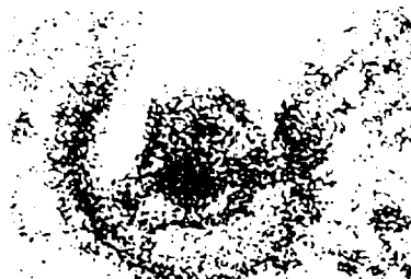
ex : agent de la grippe