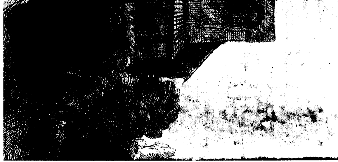
Document 1 : Trois détails, Rembrandt, Saint Jérôme au paysage italien , eau forte et pointe sèche, en partie mordue à la fleur de soufre, 25,9 x 21 cm, vers 1653.