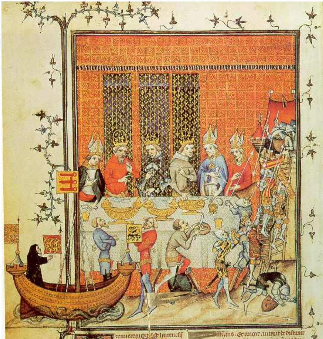
Festin offert par Charles V à l'empereur Charles VI et à son fils Wenceslas, roi des Romains, Grandes chroniques de France de Charles V , France, vers 1375-1379, Paris, Bibliothèque nationale de France

Les nombreuses nefes d'or présentes sur la table indiquent la présence de plusieurs souverains. Trois écuyers-tranchants portant des livrées aux couleurs de leurs maître respectifs, s'affairent devant la table. Un spectacle présente la prise de Jérusalem par Godefroi de Bouillon