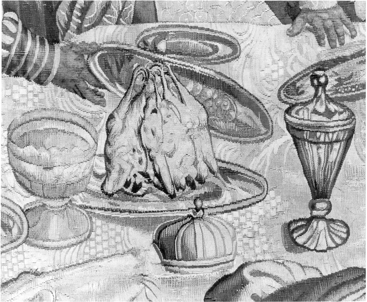
Le Repas de chasse (détail de volailles)

Tenture des Chasses de Maximilien. 7 ème tenture. Gobelins vers 1720. Musée national du château de Pau. Salle à manger des cent couverts.